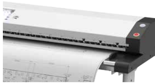
Ein USB 3.0 Anschluss zum Übertrag der Daten auf einen USB Stick.