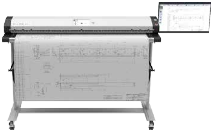
Große Dokumente, wie zum Beispiel Landkarten werden nach vorne ausgegeben

Der WideTEK® 48CL erzeugt gestochen scharfe Bilder mit einer Farbgenauigkeit, die der Qualität von CCD Scannern in nichts nachsteht. Die automatische Dokumentenrotation ermöglicht die zeitgleiche Optimierung von gescannten Dokumenten. Darüber hinaus ermöglicht der CIS Scanner die Bildbearbeitung ohne erneutes Scannen.